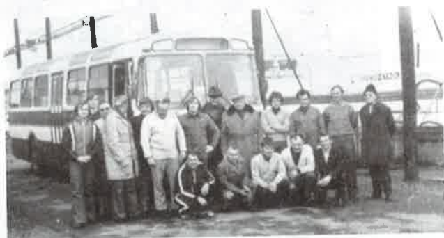
Kralupští veteráni před zájezdem do Švýcarska na kralupském ZS.