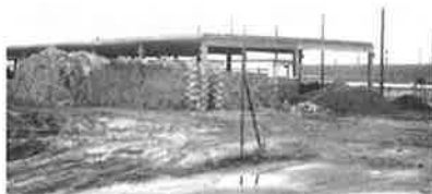
Výstavba zděných kabin na ZS Kralupy.