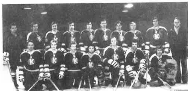
Omlazené družstvo Kaučuku po sestupu z II. ligy do kraj. přeboru I. tř. (divize byla zrušena).