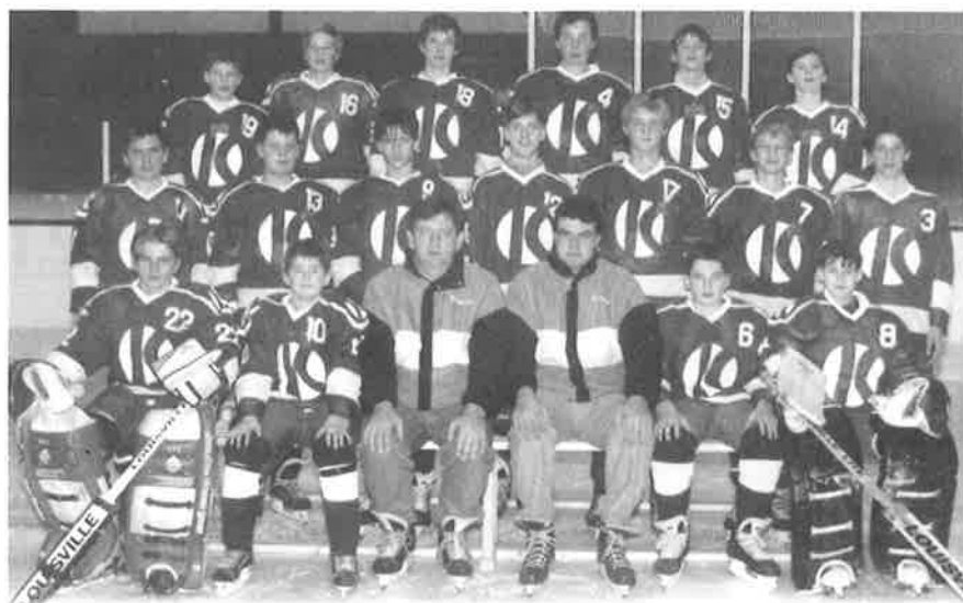
Starší žáci Kaučuku v sezóně 1994/95.

Po zvolení nového výkonného výboru v dubnu 1994 došlo i k zásadním změnám ve vedení práce s hokejovou mládeží. Systém byl postaven na základě spolupráce s oddíly vyšších soutěží. Jak se ukázalo, cesta to bylo správná. Především v sezóně 1994/95 došlo ke spojení st. dorostů HK Kaučuk a ČLTK Praha. Sloučený dorost startoval v I. dorostenecké lize pod názvem ČLTK Kaučuk. Přípravky nastoupily na led v sezóně 1994/95 již v měs. září, předcházelo setkání se všemi rodiči mládežnických družstev, rodiče byli seznámeni s plány HK Kaučuk, jednalo se také o připravovaném otevření sportovních hokejových tříd na základní škole gen. Klapálka v Kralupech n. Vlt. Podařilo se zajistit soutěž pro přípravku A třetí třídy ve spolupráci s HC Kladno. Tato soutěž zaručuje kvalitní připravenost a růst těchto dětí.