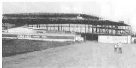
Historický okamžik, kralupský zimní stadion má již střechu!