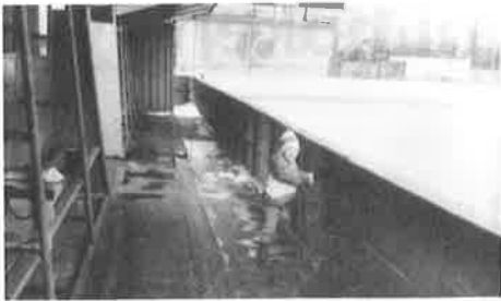
Upravená malá plocha při zastřešování hlavní plochy.