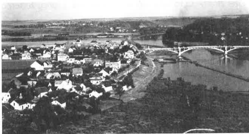
Okolí kralupského mostu za prvé republiky, pod školou velká tůň, zvaná "Holubova tůň", vlevo malý a skromný Lobeček.

Na těchto ledních plochách zcela určitě v minulosti začínali od dětských let své první kroky bruslení i pozdější práci s hokejkou a nějakým tím "kramflekem" první kralupští průkopníci ledního hokeje. Zde také začínaly první hokejové boje vedené ještě primitivním způsobem, mezi kralupskými čtvrtěmi. Za branky tehdy posloužily zprvu kameny, boty, později dřevěné branky. Kralupský hokej se zde mezi mládeží hlásil rychle k životu.