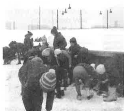
Děti nešly ani do převlékárny, bylo jich tolik, nevešly by se tam.