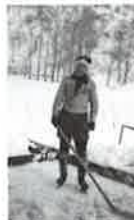
Kluziště SK Zlončice na zamrzlé Vltavě u Chvatěrub (V. Vidim).