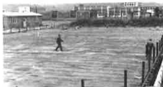
Trubky položeny, připraveny sloupky pro mantinely.

Po položení chladících hadic se vše zasypalo jemným pískem, po obvodu hrací plochy byly již připraveny železné sloupky na upevnění dřevěných mantinelů. Plocha se začala rýsovat. V rohu budoucího kluziště přibyla nová stavba, dřevěná budova, budoucí kancelář a šatna.