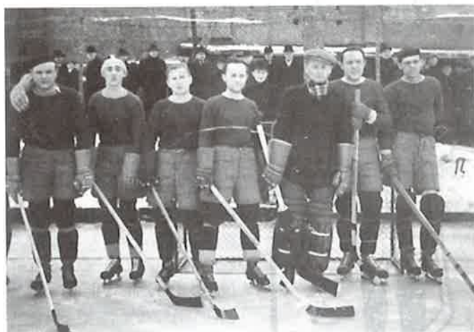
Hokejisté LTC Kralupy r. 1935/37 na svém kluzišti za továrnou "Maggi".