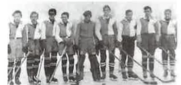
Kuriozita z Nelahozevsí, hokej na zamrzlé Vltavě bez mantinelů, dřevěné branky.