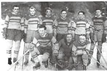
Hokejisté Čechie s novými tvářemi a novým oblečením, rok. 1943.

Za války bylo na kluzišti Čechie Kralupy sešlo II. mistrovství kralupska formou velkého, dvoudenního turnaje (sobota, neděle). Zápasy měly kratší třetiny, aby se vše stihlo. Turnaje se zúčastnily některé kluby shora jmenované. Účastníci turnaje se ubytovali v sále u Čejků, kde měli převlékárnu a občerstvení. Celý turnaj se vlivem příznivé zimy vydařil a byl také poslední tohoto druhu, hospodářská situace v protektorátu se vlivem války stále zhoršovala.