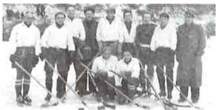
Hokejisté Čechie Kralupy na svém kluzišti na "Holubově tůni" v r. 1941/42.

Za svoji válečnou éru se hokejisté Čechie Kralupy postupně probjovali přes II. třídu až do I. třídy. Přátelská utkání hráli většinou s kluby z širokého okolí Kralup. Na exhibiční utkání si zvali hokejová mužstva vyšších tříd z Prahy. Mistrovské soutěže hráli nejdříve s kluby z okolí, později při postupu do vyšší třídy také s pražskými oddíly.