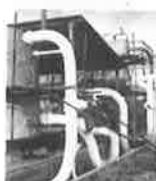
Pracuje strojní část, ojištěné potrubí

Po připevnění dřev. mantinelů a dokončení strojní části bylo přikročeno k provozním zkouškám chlazení. Provozní zkoušky proběhly bez větších problémů, na ploše zimního stadionu se objevil první neoficiální umělý led.