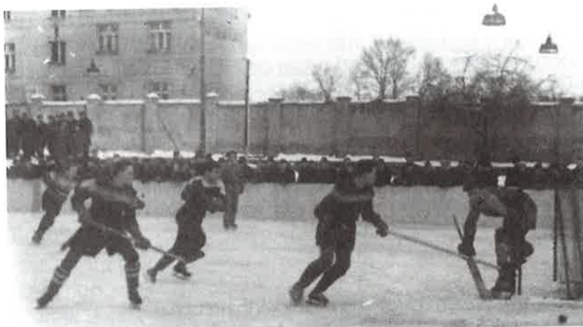
Divizní utkání na Sokolišti Lokomotiva Kralupy - Sokol Říčany (3:5). Brankář Zbyněk Czechmann, před ním Vorel, připraven útočník Čtvrtníček.