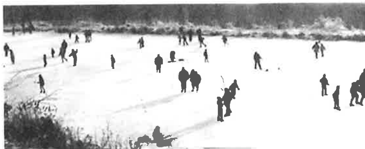
Tůň pod školou v zimě (tzv. "Holubák").