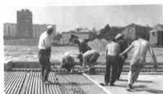
Kralupský vynález, děláni betonových žlabků pro chladící trubky.

Na budoucí hrací ploše vznikl zatím betonový podklad, na kterém se "kralupským vynálezem" vytvářely betonové vlnky pro uložení chladících hadic z umělé hmoty.