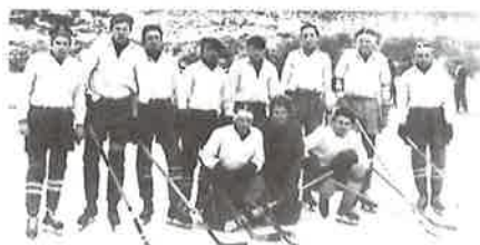
Hokejisté Čechie Kralupy v roce 1941.