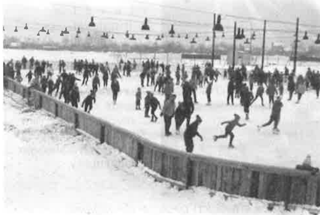
Pohled po zahájení bruslení směrem na pokladnu, v Kralupech je ten den pravá mrazivá zima.