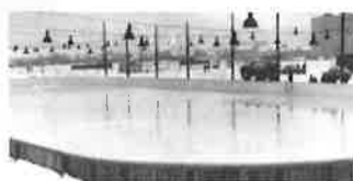
Proud vody na prvý led musel být silný, pomohly kropící cisterny, kluziště očekává slavnost. zahájení.