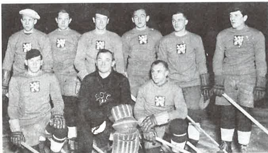
Prvé mistrovství světa a Evropy v Praze na nově otevřeném ZS na Štvanici v roce 1933.

Po roce 1930, kdy se hokej v okolí Kralup neustále popularizoval, hostovala na LTC Kralupy mužstva z okolí Kralup; Velvary, Veltrusy, Libčice, Otovice a ostatní.