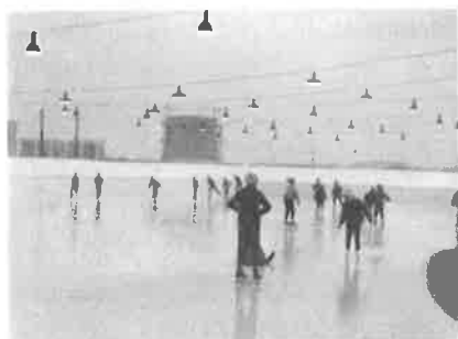
První bruslíci, kluziště je již osvětleno.