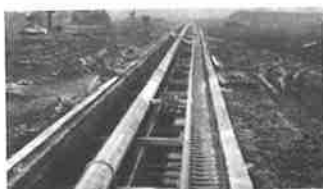
Nejdříve se stavěl a instaloval chladicí kanál.

Při výstavbě ve vztahu k budoucí hrací ploše se objevil jako první chladicí kanál s potrubím a rozvody chladících trubek z umělé hmoty. Současně se stavěla v zadní části objektu na hranici s Odborným učilištěm strojní část Zimního stadionu.