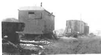
Na začátku byly dvě maringotky, v první kancelář, ve druhé materiál.