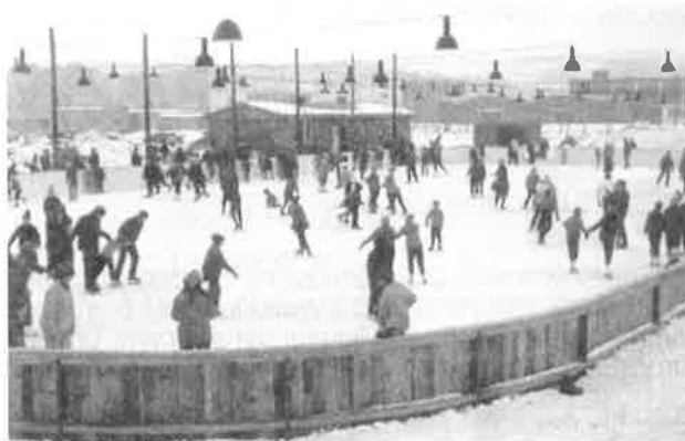
Celkový pohled na kluziště po zahájení bruslení, v pozadí je barák, v něm šatna a kancelář.